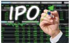
आकर्षक डिजिटल सीरीज पर केन्द्रित है।

बिजनेस रेमेडीज/जयपुर। मुंबई आधारित 'स्टूडियो एलएसडी लिमिटेड' टेलिविज़न, ओटीटी प्लेटफार्म और म्यूजिक इंडस्ट्री के लिए कंटेंट तैयार करने वाली मल्टीमीडिया प्रोडक्शन कंपनी है। कंपनी द्वारा पूंजीगत व्यय राशि जुटाने, कार्यशील पूंजी आवश्यकताओं और सामान्य कॉर्पोरेट उद्देश्यों की पूर्ति हेतु एनएसई इमर्जेंट प्लेटफार्म पर आईपीओ लाया जा रहा है। बिजनेस रेमेडीज की टीम ने कंपनी के प्रोस्पेक्टस से कंपनी की कारोबारी गतिविधियों के संबंध में जानकारी हासिल की है। कारोबारी गतिविधियाँ: फरवरी 2017 में स्थापित, स्टूडियो एलएसडी लिमिटेड एक मल्टीमीडिया प्रोडक्शन हाउस है जो टेलीविज़न और ओटीटी प्लेटफार्म के लिए कंटेंट तैयार करने में विशेषज्ञता रखता है। यह कंपनी भारत भर में अभिन्न कहानी कहने और उच्च-गुणवत्ता वाले, शैली-परिभाषित शो के लिए